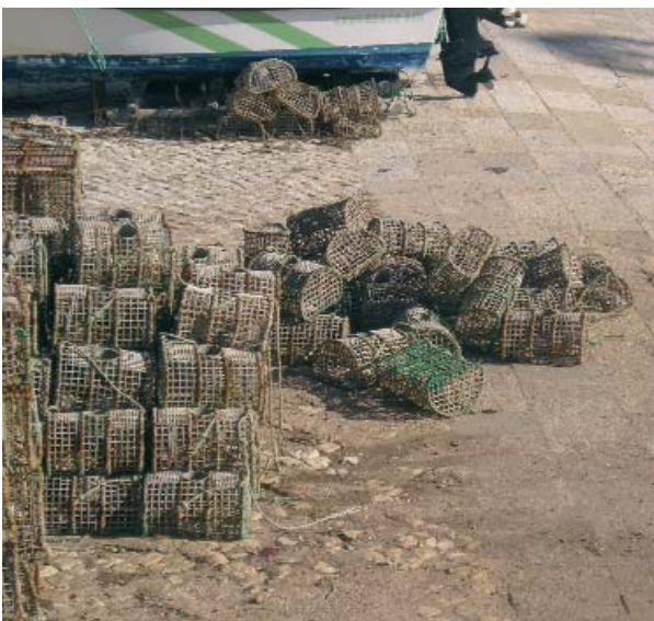
LOS UTILLAJES, ASÍ COMO OTROS ELEMENTOS DE TRABAJO, PUEDEN DETERMINAR EL TIPO DE IMPACTO AMBIENTAL