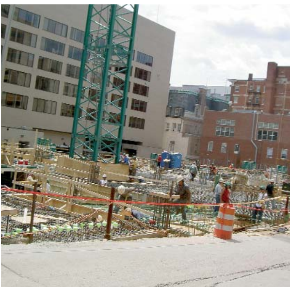
LA CONSTRUCCIÓN ES UNA DE LAS ACTIVIDADES QUE MÁS INCIDENCIA PUEDE TENER SOBRE EL MEDIO AMBIENTE

La realidad ambiental de cada familia profesional es diferente. Debemos preguntarnos qué reflexiones nos ayudarán a conocer los principales problemas de nuestra ocupación y cuáles son las medidas que se deben llevar a cabo para evitarlos. A continuación se proponen una serie de preguntas cuya respuesta ayudará a alcanzar los objetivos anteriormente expuestos.