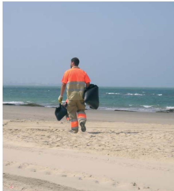
LAS BUENAS PRÁCTICAS AMBIENTALES PUEDEN LLEVARSE A CABO DESDE CUALQUIER OCUPACIÓN

mente prioritarias, ya sea por los posibles impactos ambientales que pueden causar o por el gran número de personas que trabajan en éstas. Los manuales, con contenidos más específicos, son: restauración, explotación ganadera, cuidados auxiliares, albañilería y acabados, explotación agrícola y extracción y transformación del corcho.