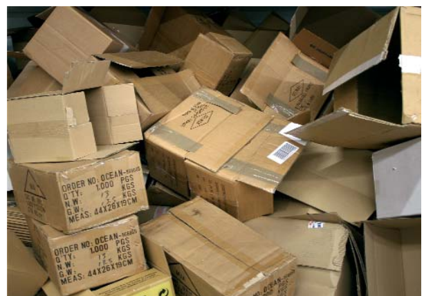
EL MEDIO AMBIENTE EN LA EMPRESA ES UN FACTOR DE COMPETITIVIDAD

Además, a lo largo de su ciclo de vida, los productos continúan incidiendo de una u otra forma en la calidad ambiental y, por tanto, en nuestra calidad de vida.