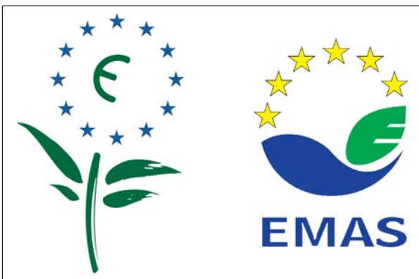
EL ETIQUETADO ECOLÓGICO Y LA CERTIFICACIÓN AMBIENTAL AVALAN SISTEMAS DE PRODUCCIÓN Y GESTIÓN RESPETUOSOS CON EL MEDIO AMBIENTE

Los sistemas de gestión ambiental proceden de la aplicación a la empresa de una norma estándar que ha sido elaborada por una entidad privada o pública con la inten-