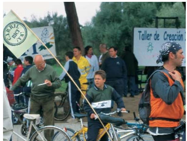
ES FRECUENTE QUE LAS PERSONAS QUE DISFRUTAN LA NATURALEZA SE ASOCIEN ENTRE ELLAS

En este apartado se incluyen asociaciones de vecinos, culturales de variada naturaleza, asociaciones deportivas, de la tercera edad, colegios profesionales, para la defensa de inmigrantes, viajes, deportes de aventura, etc. Es éste un elemento más que hace pensar en la integración definitiva del medio ambiente como unidad de interés para todos los ciudadanos.