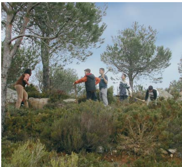
VOLUNTARIOS EN UNA ACTIVIDAD DE REFORESTACIÓN

La responsabilidad de los voluntarios con el medio y la sociedad cumple una doble función: posibilita el cambio de actitudes y comportamientos de los propios voluntarios y su actitud influye sobre el resto de la sociedad.