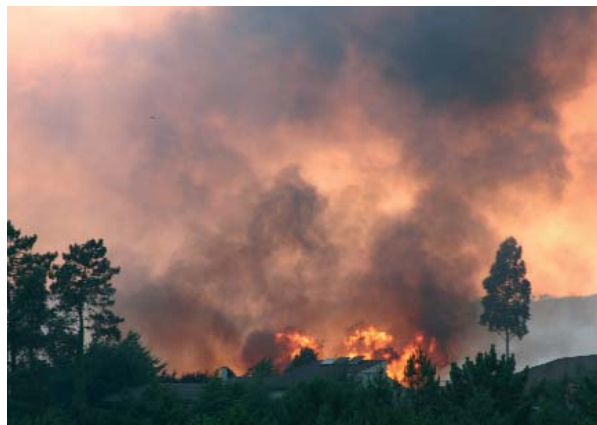
LOS INCENDIOS FORESTALES SON UNA DE LAS GRANDES PREOCUPACIONES AMBIENTALES DE LOS GOBIERNOS

También a escala nacional existen otros organismos de carácter consultivo donde participan los diferentes sectores políticos, científicos y sociales implicados en las decisiones ambientales, como el Consejo Asesor de Medio Ambiente y la Red de Autoridades Ambientales.