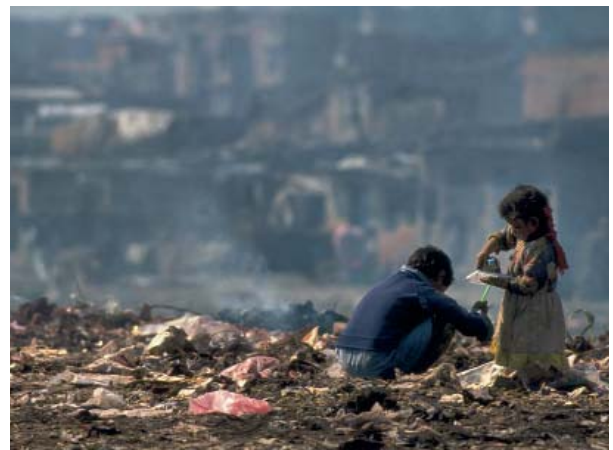
LA AGENDA 21 PRETENDE REDUCIR LAS DESIGUALDADES ENTRE PAÍSES

Los objetivos se concretan en la lucha contra la pobreza, la protección y el fomento de la salud, la protección de la atmósfera, la conservación y el uso racional de los recursos forestales, la lucha contra la desertización, la protección de los ecosistemas de montaña, el desarrollo de la agricultura sin agredir al suelo, la conservación de la biodiversidad, la gestión racional y ecológica de la biotecnología, la protección de los recursos oceánicos y de agua dulce, la seguridad en el uso de los productos tóxicos y la gestión de los residuos sólidos, peligrosos y radiactivos. Como se ve, los temas apuntados son de una complejidad enorme y requieren un trato cuidadoso.