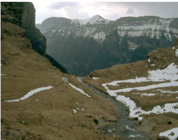
LOS ESPACIOS NATURALES PROTEGIDOS COMPETEN A LAS COMUNIDADES AUTÓNOMAS