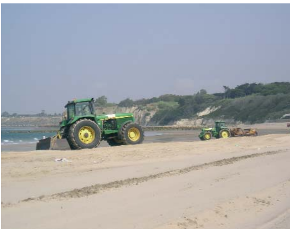
LA MEJORA DEL LITORAL ES COMPETENCIA FUNDAMENTALMENTE DEL MINISTERIO DE MEDIO AMBIENTE

La figura 10 resume las competencias legales en medio ambiente.