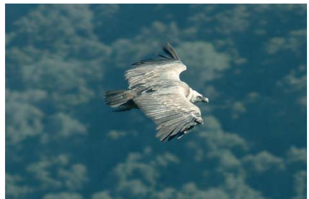
LAS AVES SON OBJETO ESPECÍFICO DE LAS POLÍTICAS AMBIENTALES DE LA UNIÓN EUROPEA