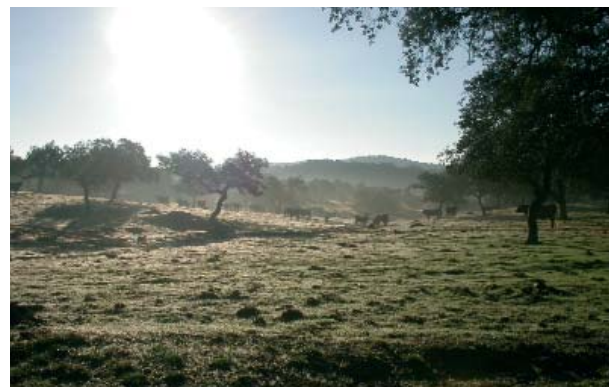
AUNAR DESARROLLO ECONÓMICO Y MEDIO AMBIENTE NO ES TAREA FÁCIL, PERO SÍ ES POSIBLE

Con posterioridad a estas cumbres, se ha seguido trabajando en el desarrollo y la evaluación de los acuerdos firmados. La referencia más importante ha sido la Cumbre de Johannesburgo 2002 (denominada Río+10), en la que se puso de manifiesto un saldo ambiental negativo y un aumento de la pobreza. Sin embargo, sí se plasmó el deseo de no reiniciar un debate filosófico y político en favor de la obtención de acciones y resultados reales.