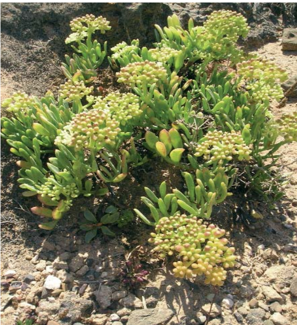
LA INTERACCIÓN ENTRE CLIMA Y SUELO DETERMINA LA VEGETACIÓN

Se denomina ecosistema al espacio constituido por un medio físico concreto y todos los seres que viven en él, así como las relaciones que se dan entre ellos .