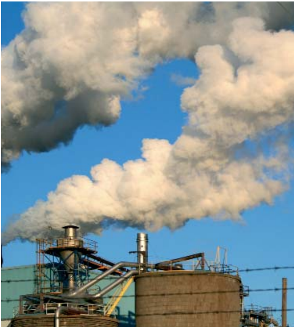
LA CONTAMINACIÓN ATMOSFÉRICA PUEDE TENER CONSECUENCIAS SOBRE LA SALUD

De todos los contaminantes , podríamos destacar los metales pesados, ya que son muy perjudiciales para los seres vivos y, además, son de los que poseen una mayor persistencia en el medio en el que se depositan.