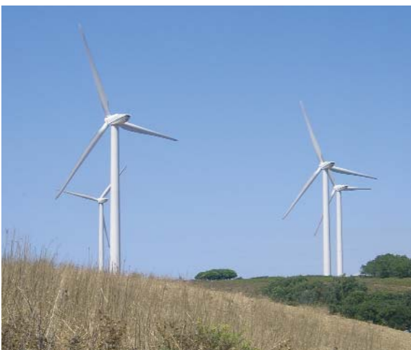
EL VIENTO ES UNA FUENTE DE ENERGÍA INAGOTABLE

Durante toda la historia del hombre, éste ha recurrido preferentemente a formas de energía no renovables, es decir,