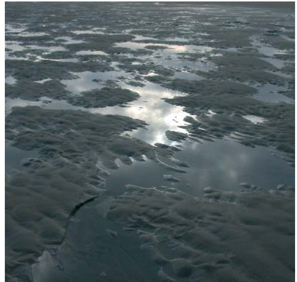
LOS ACCIDENTES DE BARCOS PETROLEROS ILUSTRAN BIEN LO DAÑINO QUE PUEDE RESULTAR UN VERTIDO

mar. Sólo es cuestión de prestar un poco de atención a los medios de comunicación para conocer sus fatales consecuencias.