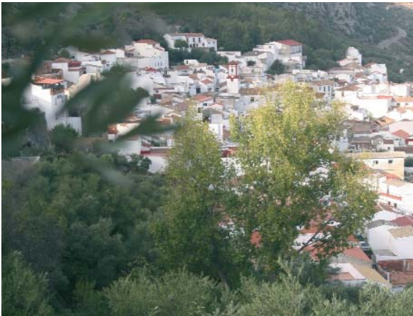
LOS NÚCLEOS URBANOS FORMAN PARTE DEL MEDIO AMBIENTE

Para poder comprender lo que ocurre a nuestro alrededor y saber en cada momento y con exactitud de qué estamos hablando, es fundamental que conozcamos un conjunto de términos básicos que se van a emplear con mucha frecuencia a lo largo de este Módulo.