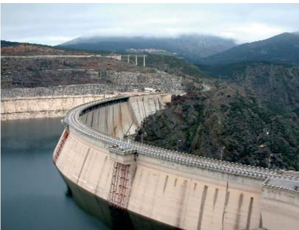
LA CONSTRUCCIÓN DE UN EMBALSE SUPONE UN CAMBIO DEL HÁBITAT DONDE SE UBICA.

Al efecto que una determinada acción humana produce en el medio ambiente se le denomina impacto ambiental .