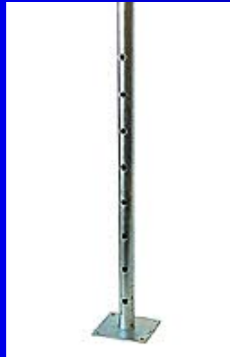
Extension Base Plate