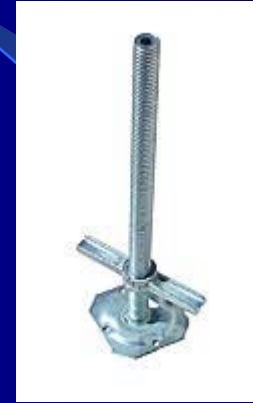
Hollow Screw Jack