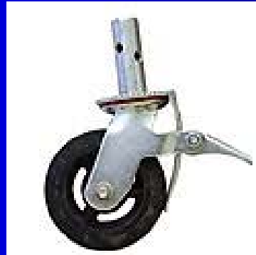
5" Heavy Duty Caster