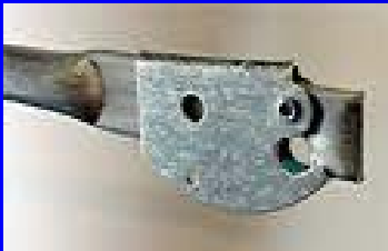
Snap On Brace