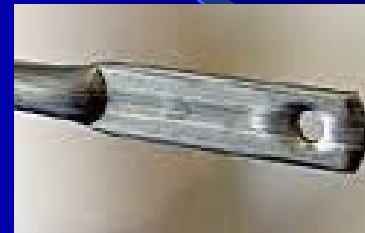
Punch Hole Brace