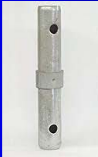
1" Collar Pin